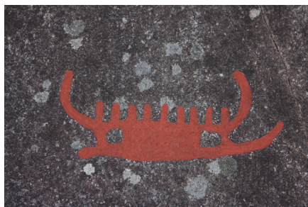
Foto: Njord, kvalitetsmärkning inspirerad av Tanums hällristningar © Gordon McInnes