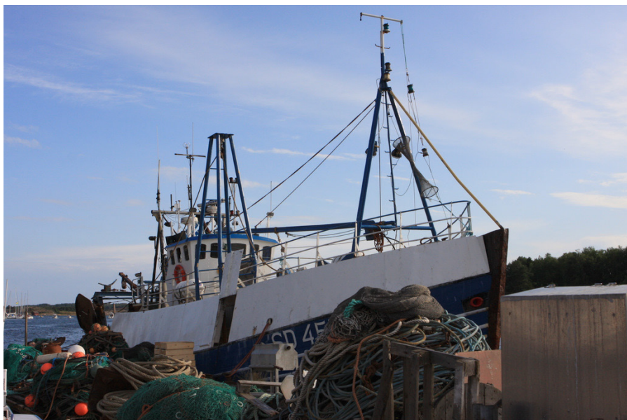
Foto: Charles och Roberts fiskebåt Ferder förtöjd i Grebbestad © Gordon McInnes

havet och fiske. Fiskare i Tanum och Strömstad har utvecklat varumärket som en garanti för en spårbar, miljövänlig och lokalt framställd produkt. Logotypen för varumärket består av namnet Njord ovanför en bild av en fiskebåt som inspirerats av de gamla hållristningarna i området. Charles skulle vilja att Kosterhavsområdet blir känt för sin kvalitetsmat. Han är glad över att få använda Njordvarumärket så att han kan visa att han har fångat sina räkor lokalt, landat dem inom