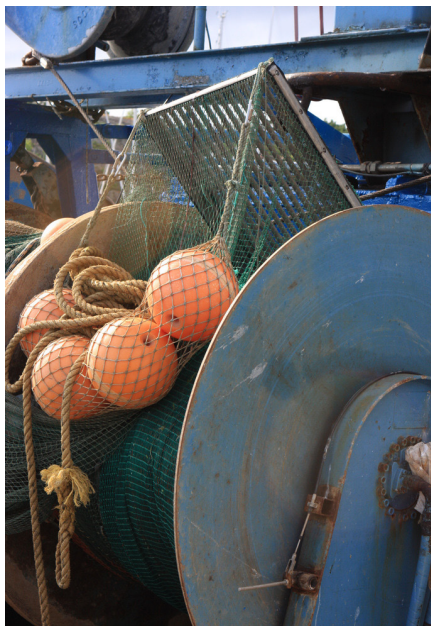
Foto: Fiskeredskap på Ferder inkluderande aluminiumgaller för att minska bifångster

Yrkesfiskarna har i sin tur arrangerat kurser för lokala forskare och politiker för